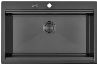
Évier Milanello Gun Metal workstation 1034 056