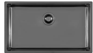
Évier KE Filotop Gun Metal 2157 056